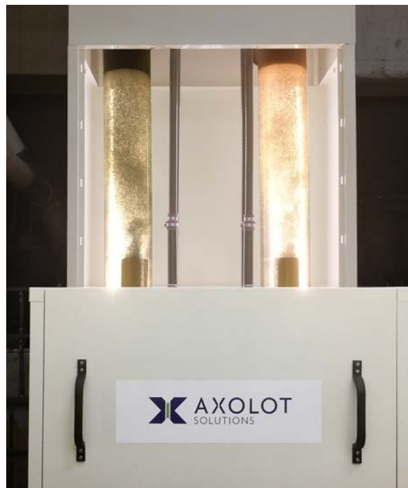
AxoPur-anläggning i reguljär drift.