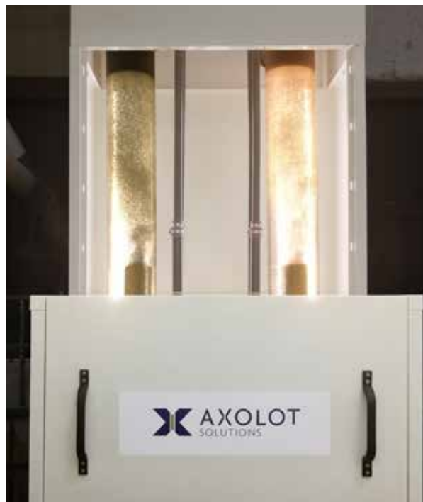
AxoPur-anläggning i reguljär drift.