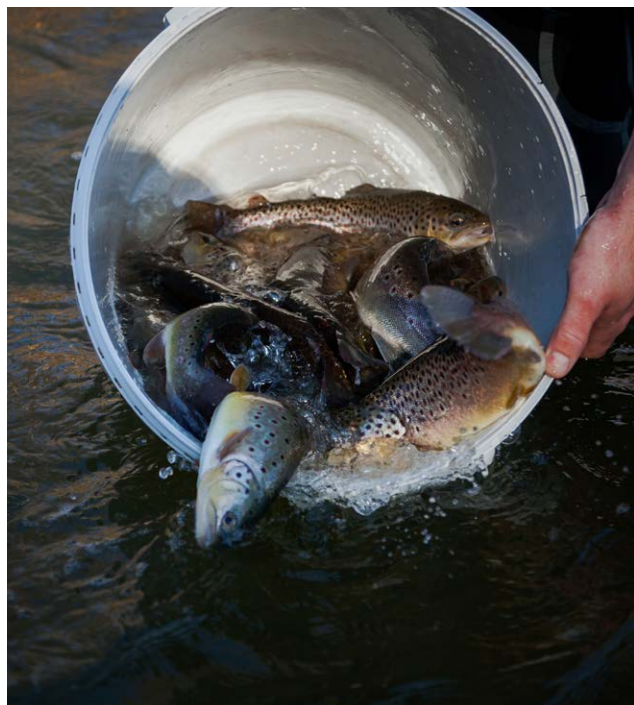
Axolot har byggt upp en hel del erfarenhet från fiskodling och slakt av odlad fisk, och på detta område är en hög vattenkvalitet helt avgörande.