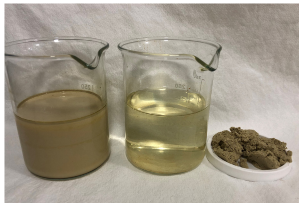
Till vänster i bild ses avloppsvatten som ska renas. AxoPur processen separerar avloppsvattnet till renat vatten (i mitten) och en så kallad flock (till höger).