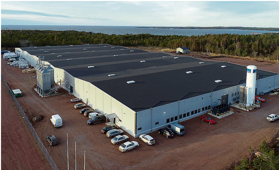
Snart odlas laxöring i samtliga 36 bassänger i Fifax 15.000 kvadratmeter stora anläggning i Storby, Eckerö.

Efter en utdragen leverantörstvist ligger Fifax Ab mer än tre år bakom den ursprungliga tidsplanen.